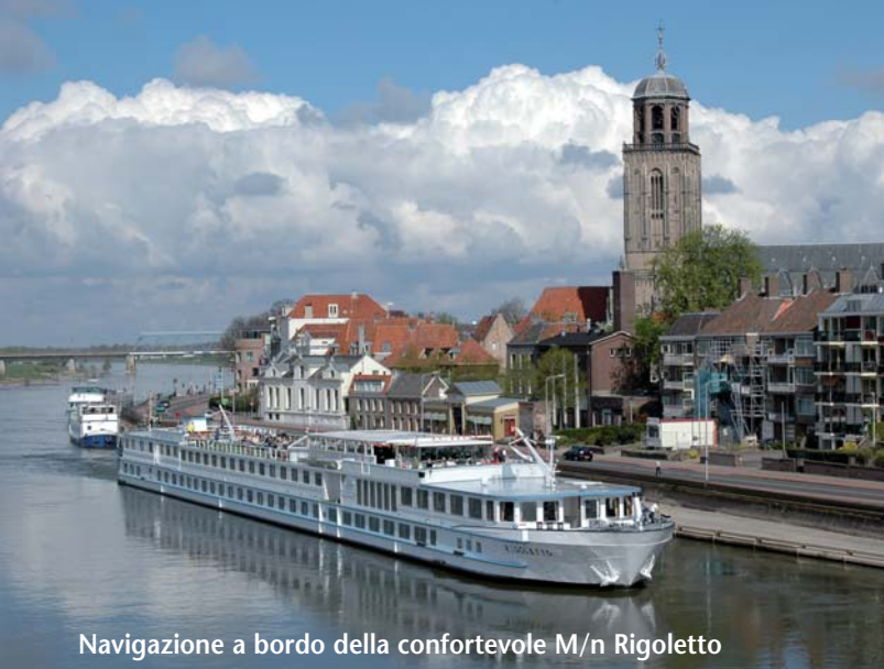
Navigazione a bordo della confortevole M/n Rigoletto