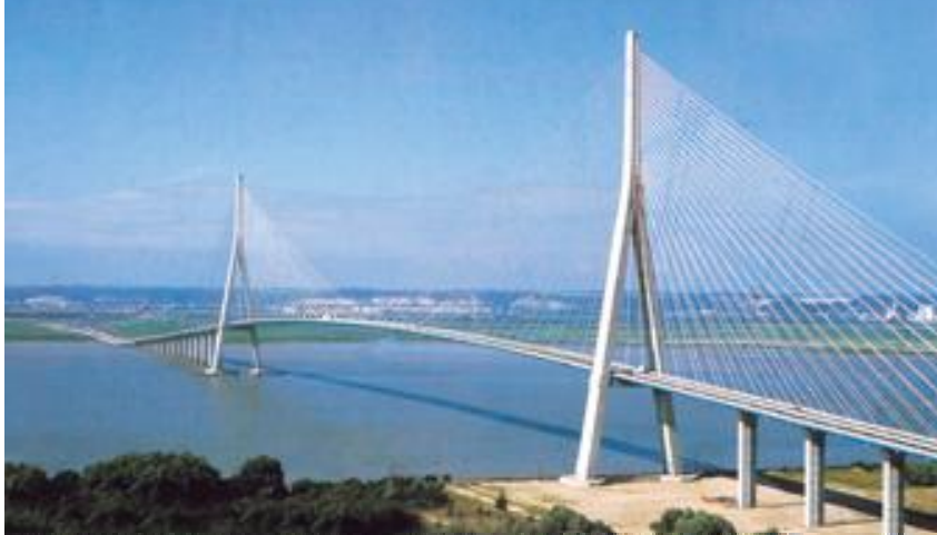
Ponte di Normandia

Nota bene: per ragioni di sicurezza di navigazione la Compagnia ed il Comandante della nave possono decidere di modificare il programma della crociera. La tassa aumento costo carburante è applicata obbligatoriamente nella misura di Euro 2,00 al giorno a persona.